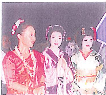
バングラデシュにて